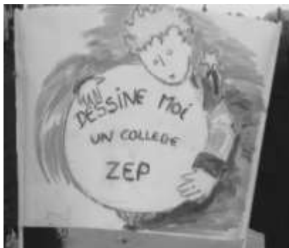
Une banderole très médiatisée des collègues de Pasteur Mâcon.

ont eu lieu. Associant souvent les parents et les élèves, elles ont mis au jour l'écart qui existait entre la réalité vécue et la représentation qu'en a l'institution, basée sur des indicateurs souvent erronés. La convergence au niveau national n'a pas pu se faire. Si le combat n'a pas été victorieux, les personnels peuvent être fiers d'avoir défendu le service public et la qualité de l'accès à l'éducation. La vigilance est maintenant de mise pour que les promesses du maintien des moyens pour les établissements sortis de l'éducation prioritaire soient tenues.