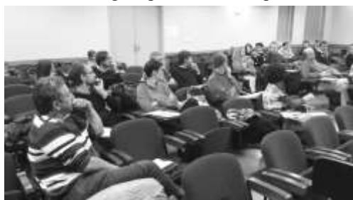
Stage syndical sur le management novembre 2015